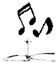
Karya Lagu (Hak Cipta)