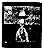
Karya Siaran Televisi (Hak Terkait)